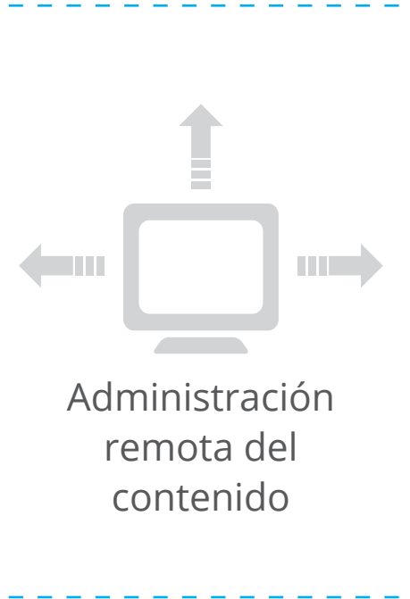
Administración remota del contenido