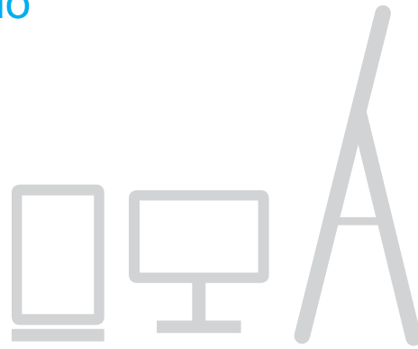
Venta de pantallas